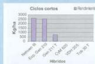
Gráfico N° 1: Rendimiento cultivares ciclo corto