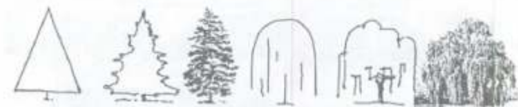
Piramidal o cónica