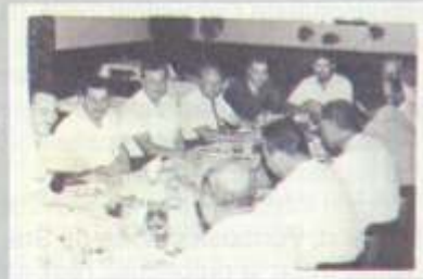
Celebración habilitación serv. Larga distancia