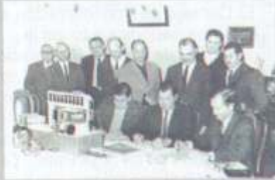
Contrato con Siemens