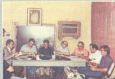
Ampliación de la Central