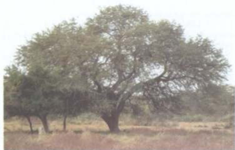
Prosopis nigra (algarrobo)

"PLANTAR UN ÁRBOL ES UNA ACTIVIDAD QUE ARMONIZA AL HOMBRE CON SU AMBIENTE, ADEMÁS LO COMPROMETE CON LAS GENERACIONES SUCESIVAS"