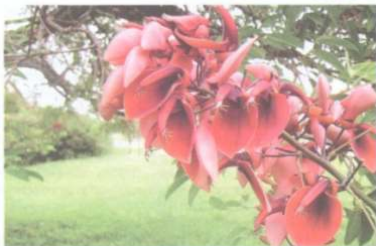
Flor de Erythrina crista galli (Seibo), árbol nacional

La prédica de Sarmiento encontró eco treinta años después, cuando el 29 de agosto de 1900, el Consejo Nacional de Educación, en base a la iniciativa del Dr. Estanislao Zeballos instituyó dicha fecha en celebración al "Día del Árbol", y cuyo festejo se concretó a partir de 1901.